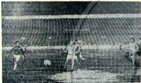
Резултатът е вече 1:0 за ЦСКА. ЦСКА и „Ливърпул“ — 2:0.)